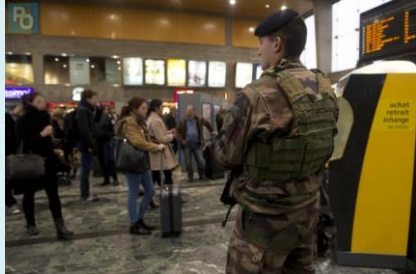
Plan « Vigipirate » en gare de Nantes