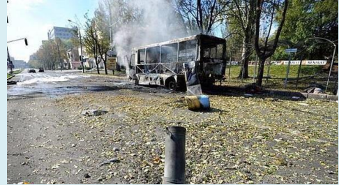
Autobus détruit à Donetsk(Ukraine) (janvier 2015)