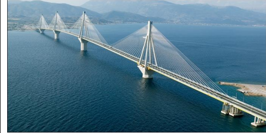
Surinvestissement routier en Grèce (pont de Rion Antirion)