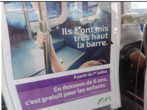
La Semitan encourage la mobilité des plus jeunes

....Courant octobre vous redécouvrirez un numéro plus classique. Nous serons alors dans la bagarre des élections régionales où l'ANDE compte bien faire avancer les dossiers de l'étoile ferroviaire nantaise et en appelle d'ores et déjà à vos contributions.