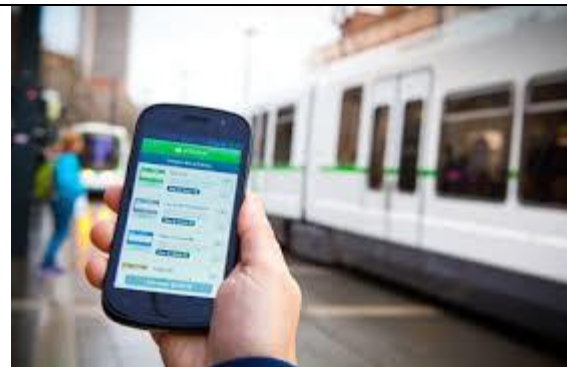
et augmente drastiquement tous les tarifs (sauf achat au conducteur) sans offre nouvelle de service (hors secteur Couëron et navibus)