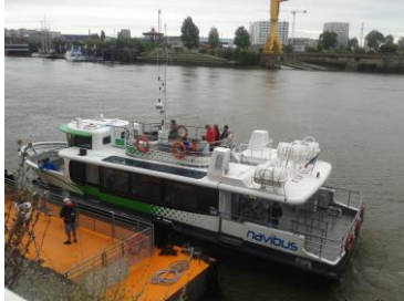
Navibus à Trentemoult