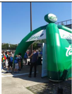
Nantes Métropole prône officiellement l'intermodalité (stand Semitan à « Velocity »)