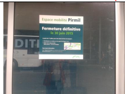
...et ferme le guichet du pôle intermodal de Pirmil visité pourtant au printemps par ses responsables en compagnie du Collectif transport