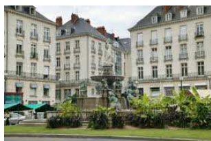
Oui à la Place Royale déménalisée