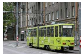
penser bien au-delà (Tallin)