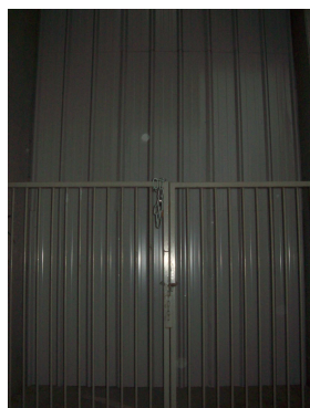
En attendant les inévitables » tags »