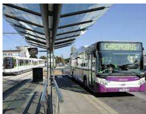
agir localement (Nantes)