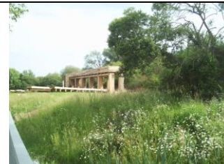
2012 : un faux péage en bois (Malakoff)

Tous les lecteurs de cette lettre d'information sont invités à venir fêter le 40 e anniversaire de l'ANDE le