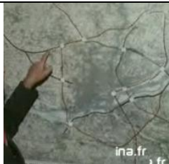
1972 : la promesse d'autoroutes urbaines