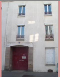
Nouveau siège de l'ANDE

Les amis de l'ANDE entendront donc parler de passage à niveau, de caténaires et d'accès au quai lors de la prochaine année